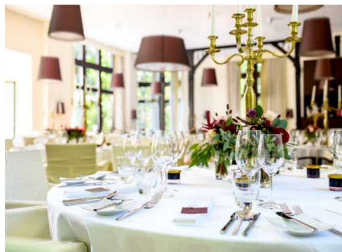
Festlich gedeckter Tisch im historischen Salon