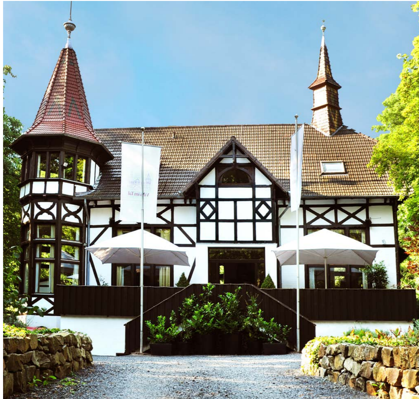
Die Villa im Tal – Sommerresidenz von Kaiser Wilhelm II