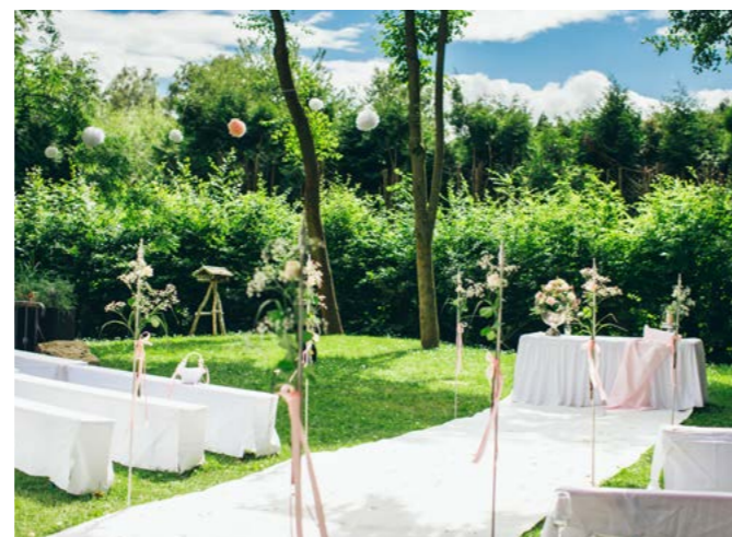
Freie Trauung im Garten